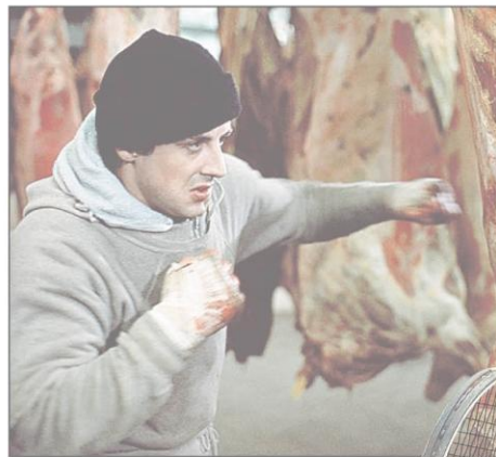
Sylvester Stallone als Box-Held „Rocky“ (links) motiviert Rafael Nadal.